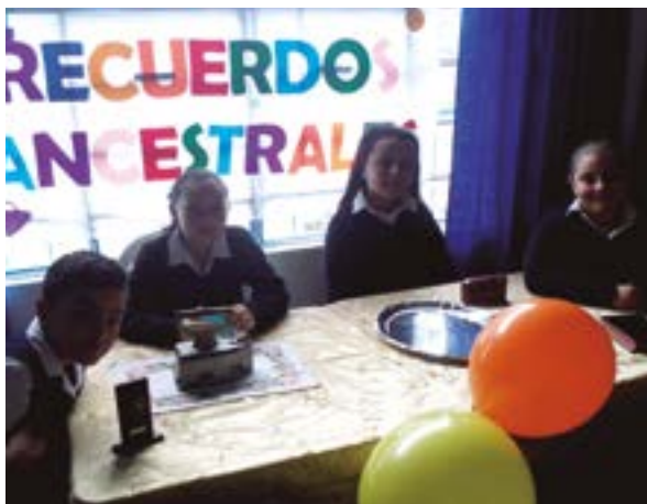
I.E Rosa María Henao Pavas