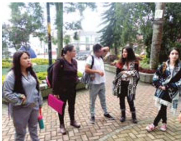
Normal Superior Maestros en Formación Ciclo Complementario