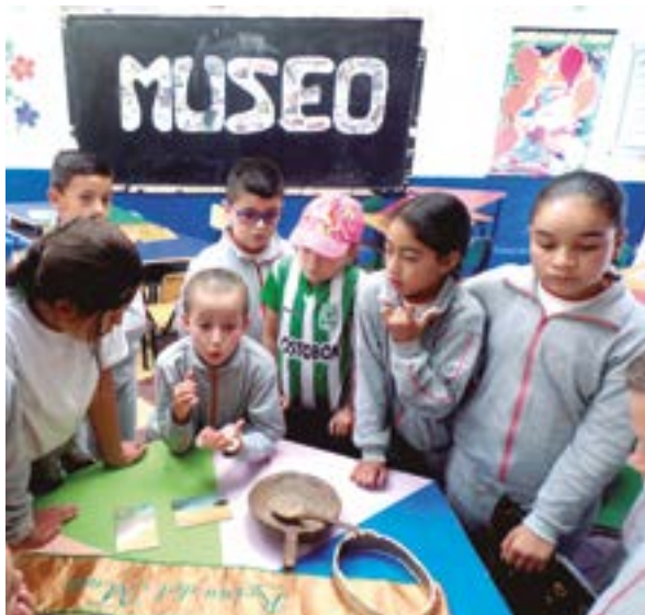
I.E Río Arriba