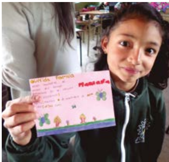
I.E La Honda