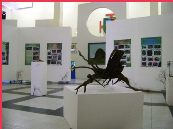
MUSEO EL PEÑOL.

La gran misión del museo en convertirse en un referente de la identidad de su entorno y es por ello que con la valoración y difusión de los nichos de vida del embalse, el museo fortalece su dimensión política, más allá de simplemente estar explicando en un guión la nostalgia de un