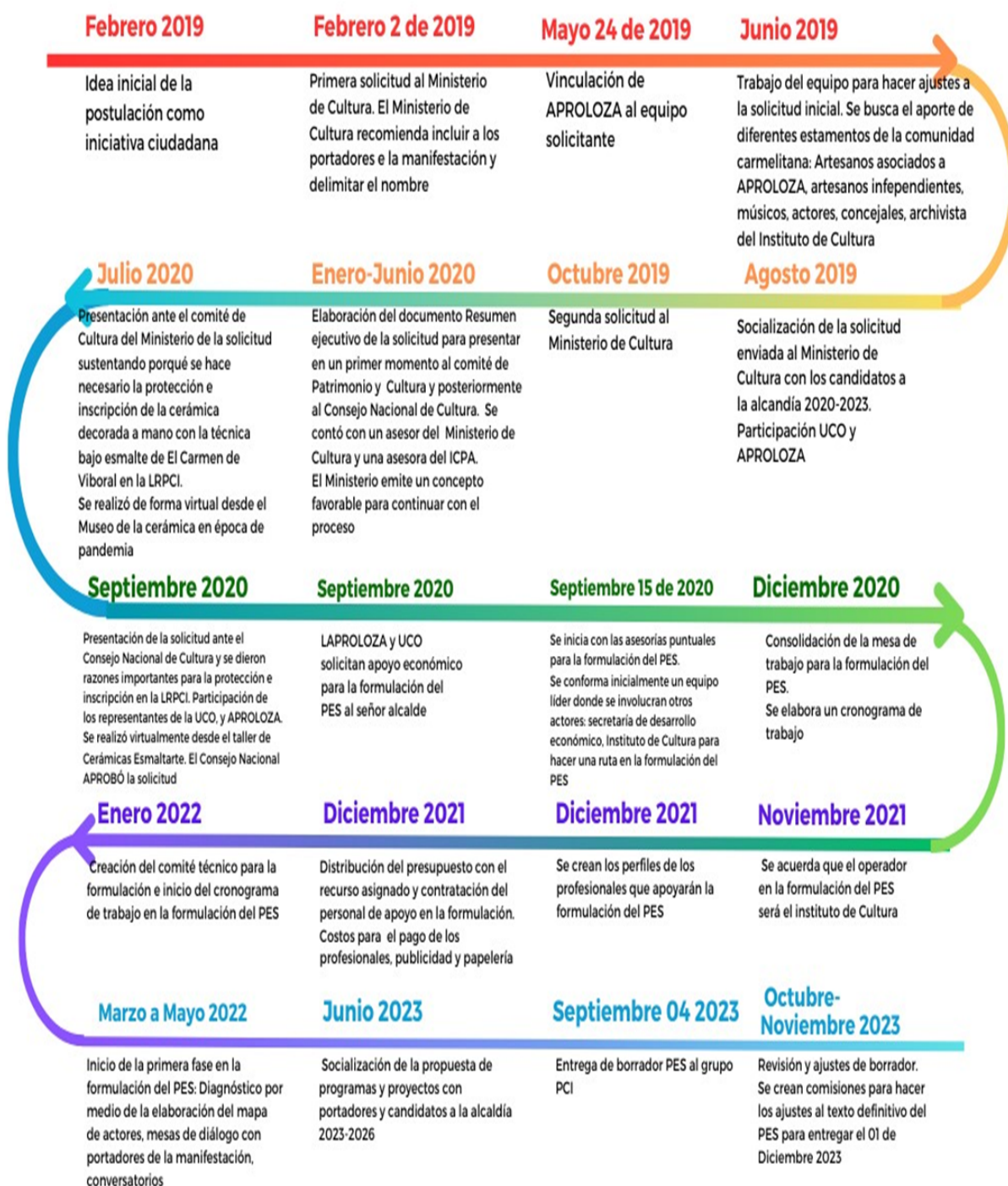
Linea del tiempo del proceso de formulación del Plan Especial de Salvaguardia de la Cerámica