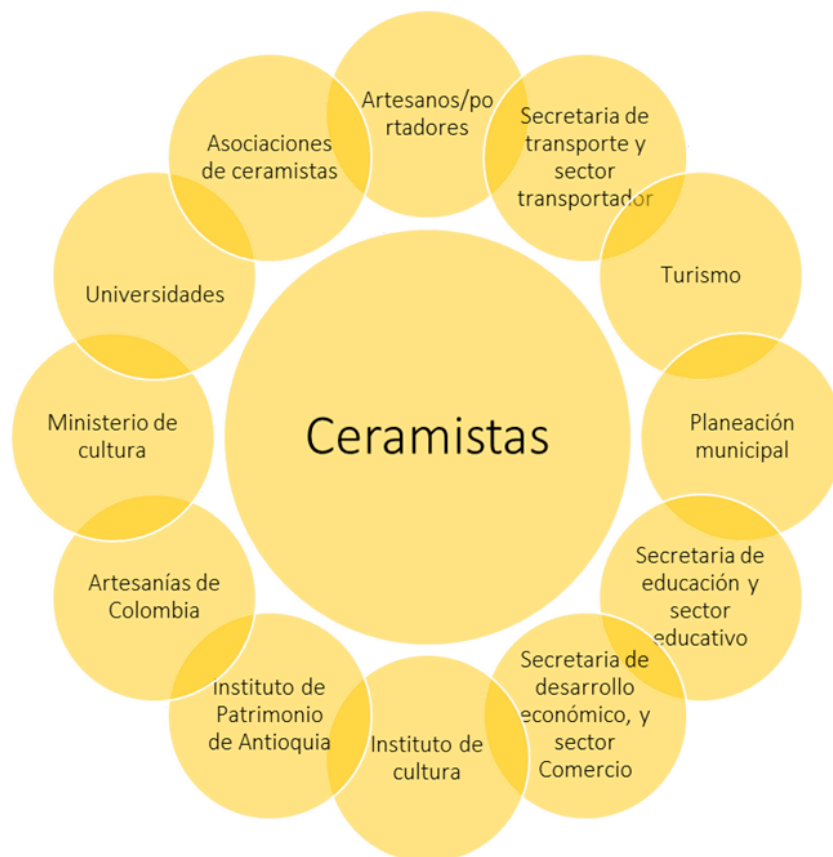
Mapa de actores, comunidad relacionada con la manifestación de la cultura ceramista de El Carmen de Viboral

Por otro lado, la Corporación de Ceramistas de El Carmen de Viboral (CERACORP) tiene como finalidad “la promoción de las artesanías de cerámica terrígena originaria del municipio y sujeta a su tradición cultural y estética acorde con la evolución de los tiempos”. La Corporación busca la promoción personal, social, económica, cultural de los ceramistas artesanos productores, para propender al mejoramiento de su nivel y calidad de vida, familiar y social”. Para alcanzar estos fines desarrollan programas y cursos de educación artística, cultural y técnica, talleres, seminarios, foros y similares dirigidos al fomento, mejoramiento y difusión de las artesanías y la cultura de El Carmen de Viboral (Certificado de existencia y representación legal, CERACORP 2022).