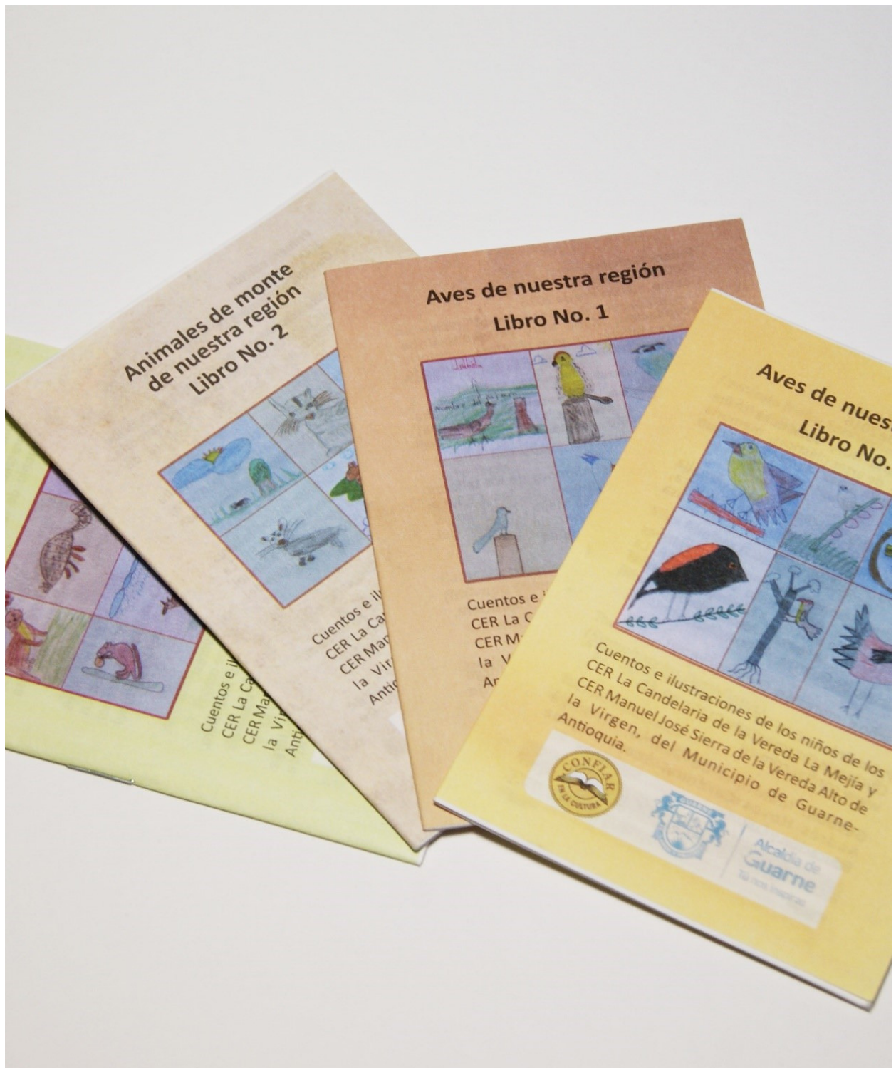
LIBRILLOS DE MINI CUENTOS ILUSTRADOS.

VIGÍAS DEL PATRIMONIO CULTURAL DE GUARNE, ANTIOQUIA