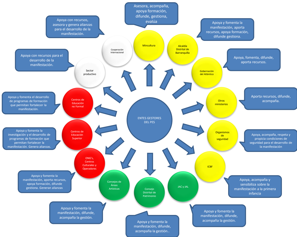
Gráfico del esquema institucional